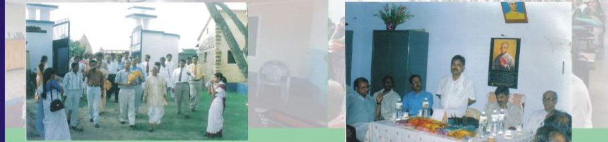
Hon'ble Vice- Chancellor of University of North Bengal deputed an Inspection Team on 24-06-2004 at Balurghat B.Ed. College