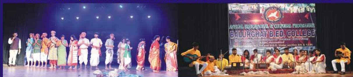
Cultural performances by the students - 2023