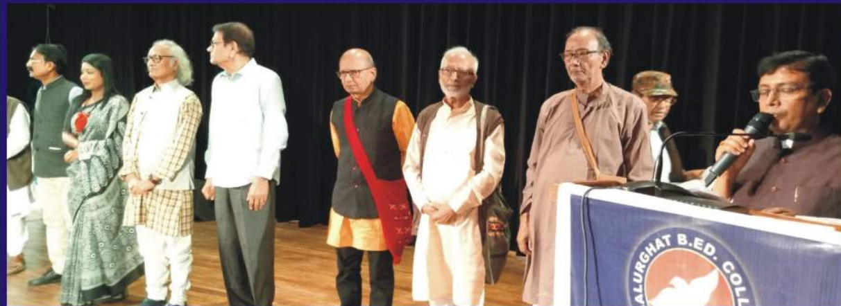
Eminent talented persons felicitated for their contributions to their respective fields