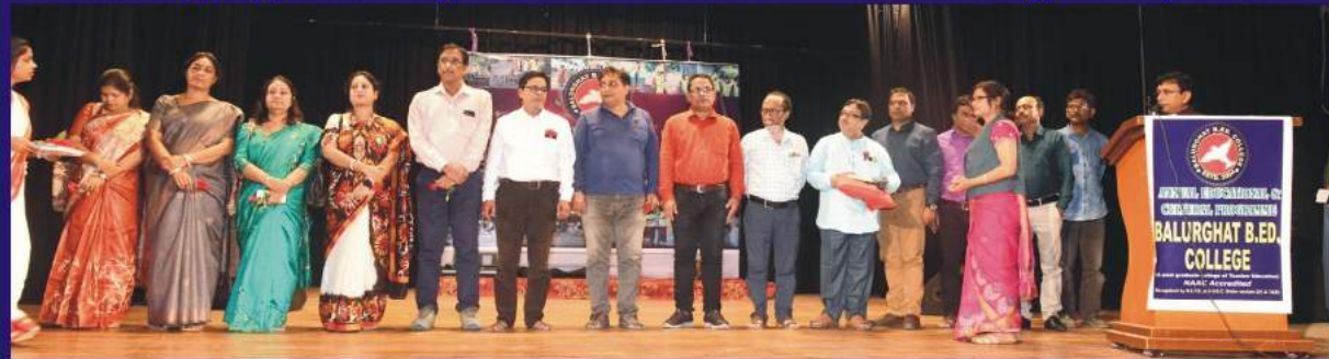
Headmasters of High Schools felicitated by the Principal of the college