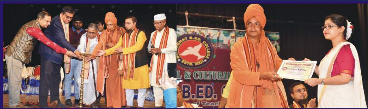
Lightening the lamp to inaugurate the Education & Cultural programme by the Vice-Chancellor & other dignified persons